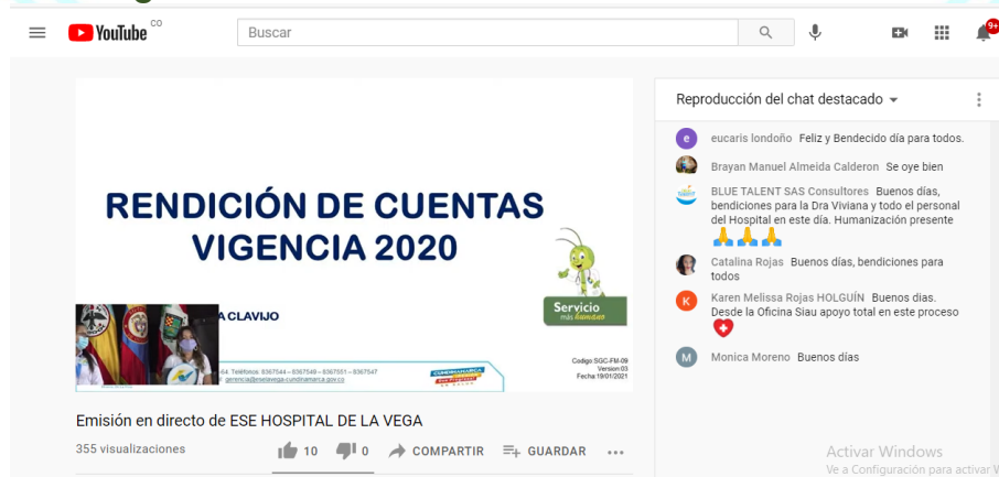
Imagen No 3: Transmisión Audiencia Pública Virtual 2020

Ante la emergencia presentada en el país por la presencia del COVID-19 y la Audiencia Pública Virtual de Rendición de Cuentas vigencia 2020, los participantes en la sesión se conectaron mediante la Red Social Facebook, link de acceso: https://www.facebook.com/ESE-Hospital-De-La-Vega-109923983981251 , así como por la transmisión en directo del Canal de Youtube, link de acceso: https://www.youtube.com/channel/UCxHCVI79RmJDYyn3id7CSvQ , la hora de apertura de los canales se realizó a partir de las 9:00 a.m, del 20 de mayo de 2021