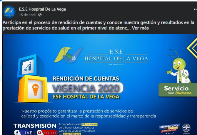
Imagen No 2: video institucional invitación rendición de cuentas